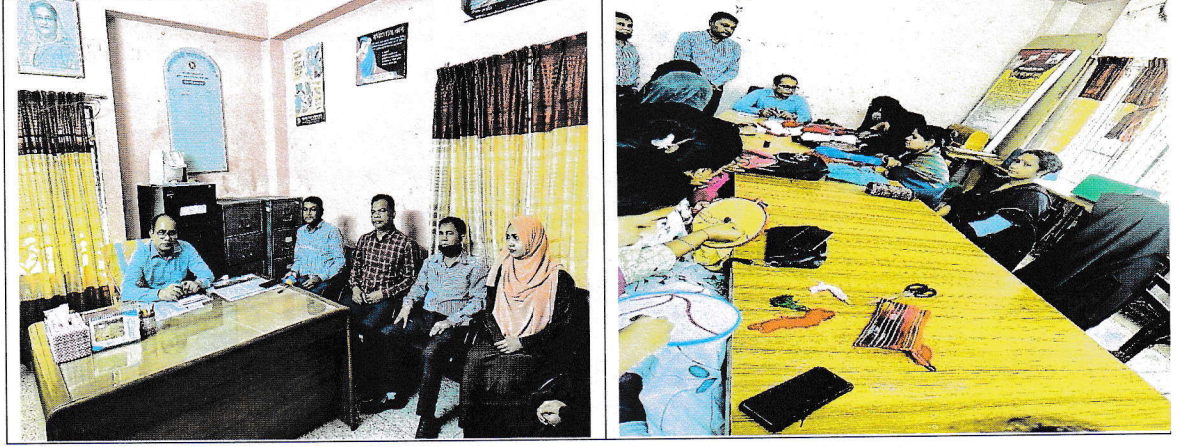
উপপরিচালকের কার্যালয় এবং প্রশিক্ষণ কার্যক্রম পরিদর্শনের ছবি।